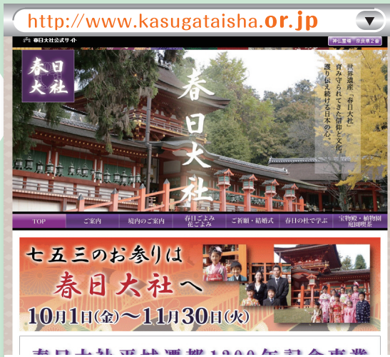
▲ 春日大社(宗教法人 春日大社)