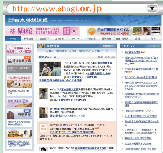
▲ 社団法人 日本将棋連盟